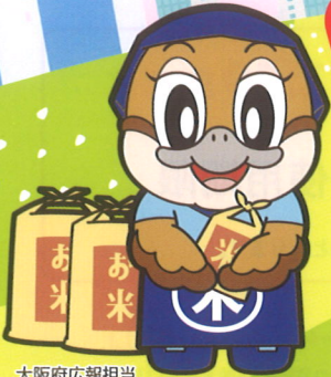
大阪府広報担当 副知事もずやん