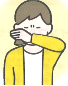
うでの うちがわ 内側で 口と鼻をおおう