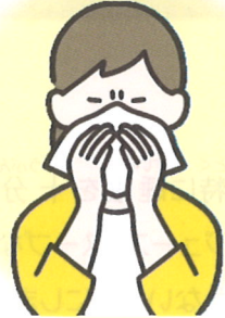
ティッシュやハンカチで 口と鼻をおおう