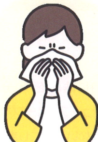
ティッシュやハンカチで 口と鼻をおおう