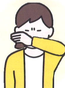
うでの内側で 口と鼻をおおう